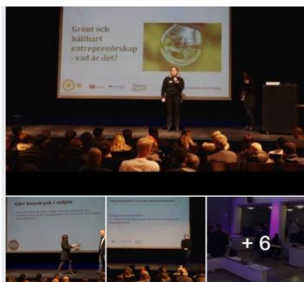
Från Facebooksida 6/11 https://www.facebook.com/CBNatureBizz

Den 6 november var vi medarrangörer vid en workshop i Vallentuna gymnasium där temat var Grönt och hållbart entreprenörskap. Deltagare på workshopen var gymnasielever och personal från gymnasiet, lokala gröna mikroföretagare, lokala politiker och andra från det lokala näringslivet. På workshopen fick vi dels höra från några mikroentreprenörer hur de jobbar grönt och hållbart, och dels fick deltagarna jobba med frågan hur nya hållbara affärsidéer i Vallentuna skulle kunna se ut. Vårt intryck var att Vallentuna är en kreativ plats med utrymme för många affärsidéer baserade på hållbarhet.