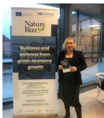
Från Facebooksida 24/11 https://www.facebook.com/CBNatureBizz

Den 20 november deltog vi i ett evenemang i Visby. Temat för kvällen var en presentation av det nyligen avslutade projektet 100 gröna och blå upplevelser, ett projekt med ett stort antal finansiärer, deltagare och intressenter. NatureBizz presenterades som en av flera framtidsmöjligheter för regionens entreprenörer.